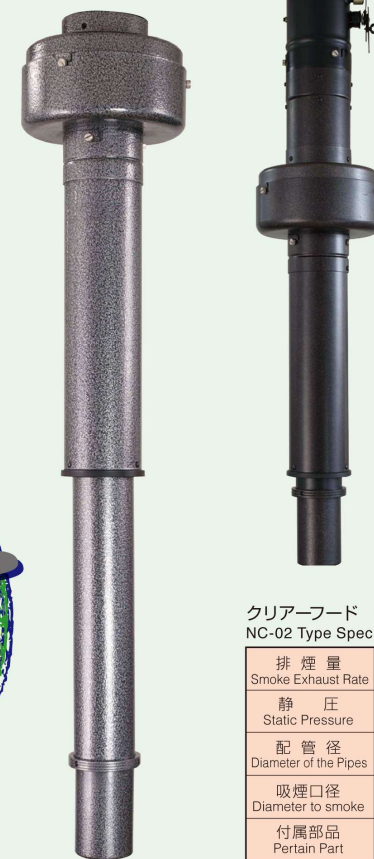
クリアーフード NC-02型仕様/ NC-02 Type Spec

●内装工事もお気軽にご相談ください。 Please feel free to inquire to us about interior work.